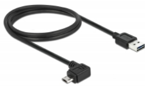
EASY-USB Micro B