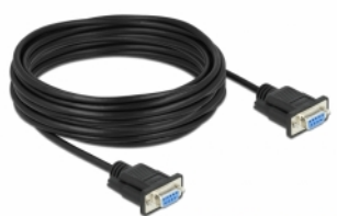
mini Sub-D 9