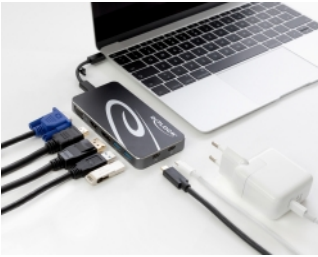
Maximum resolution (depending on the system and the connected hardware)